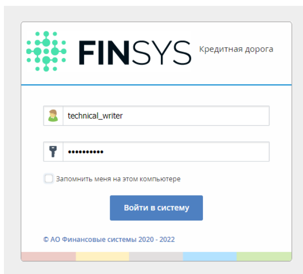
Рис. 1. Вход в систему